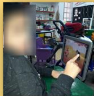
אפליקציות מותאמות באייפד

“משחק הוא הדרך של הילדים ללמוד את מה שלא ניתן ללמד אותם.”