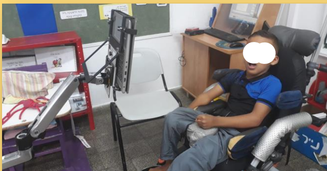
מתקשרים באמצעות מערכת מיקוד מבט