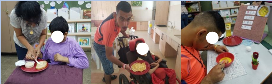
הכנת מתכונים בעקבות הסיפור "אורי אוריקן וכוח הירקות"

במסגרת שיעורי כלכלת בית הושם דגש על נושא "תזונה נבונה". המתכונים נבחרו בזיקה לסיפורים, שירים, עונות השנה וחגי ישראל. התקיימה הוראה אינטראקטיבית וחוייתית שהתבססה על סיפורים מותאמים, שירים, סרטונים, מצגות מפעילות ואפליקציות באיפוד. התלמידים התנסו בהכנת מאכלים באמצעות מתכונים עפ"י רצף פעולה בליווי אמצעים מוחשיים וסמלי תקשורת. בעקבות המתכונים למדו התלמידים מושגים מתמטיים כגון: כמויות, הרבה, מעט ועוד. בנוסף, התלמידים נחשפו לפירמידת המזון והערכים התזונתיים באמצעות משחקים דידיקטיים מגוונים.